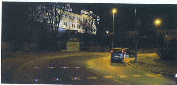
CYKLOPŘEJEZD je osázen výstražnými světly v povrchu silnice.

světel patří například to, že je řidiči ve směru od Vočtářovy ulice vidí z velké dálky a navíc výrazně zvyšují viditelnost přechodu v nočních hodinách,“ uvedl radní pro dopravu Karel Šašek. (pep)